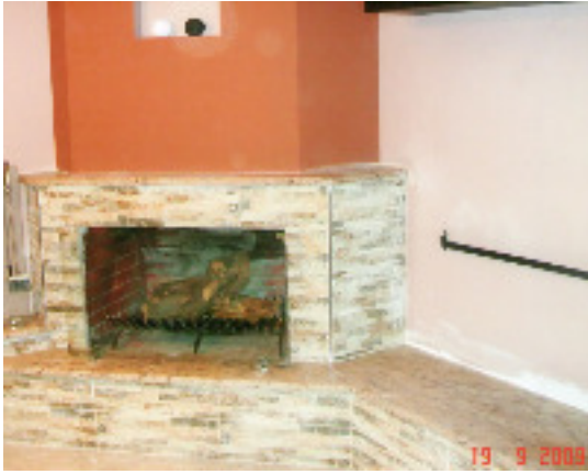
Τζάκι στον χώρο της κουζίνας